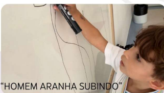
"HOMEM ARANHA SUBINDO"