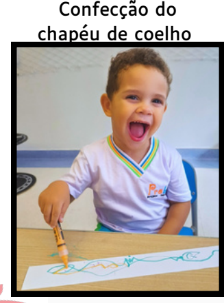
Confecção do chapéu de coelho