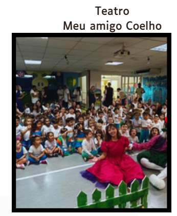
Teatro Meu amigo Coelho