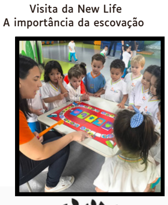
Visita da New Life A importância da escovação